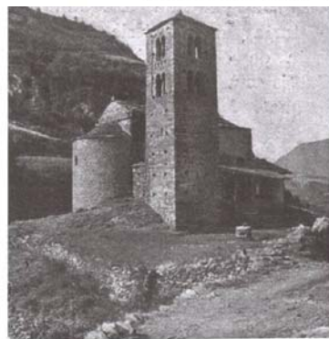
Fig. 246. — Esglesia de Sant Joan de Canillo. (Andorra.)

En el segon volum de l'Arquitectura Romànica a Catalunya de Puig i Cadafalch, A.Falguera i J.Godoy i, concretament, en el llibre segon, capítol XVII: esglésies d'una nau; apartat: esglésies parroquials amb campanar trobem citades i fotografiades les esglésies de Sant Miquel d'Engolasters, Santa Eulàlia d'Encamp, Santa Coloma d'Andorra la Vella i Sant Joan de Caselles.