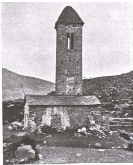
Fig. 243. — Esglesia de Sant Miquel d'Engolasters.

El projecte de Puig és un cas d'institucionalització política del fenomen cultural del romànic. La rapidesa, com ja he dit, descriu la forma d'actuar de Ors, Pijoan i ell mateix. Basat en una anàlisi històrica-estilística d'origen romà, es centra en el mètode classificatori.