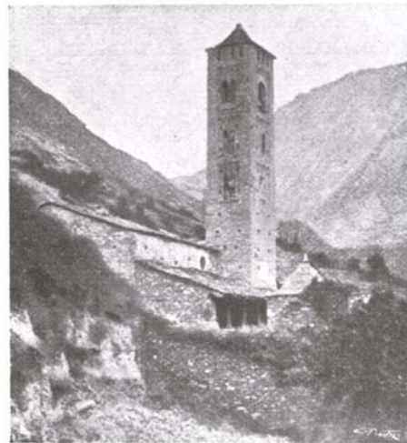
Fig. 245. — Esglesia d'Encamp.