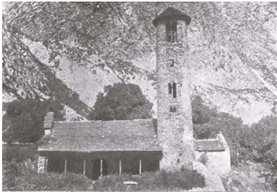
Fig. 244. — Esglesia de Santa Coloma d'Andorra.