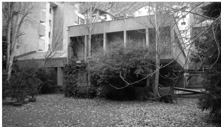
Alçat de la desapareguda editorial Casal i Vall a Andorra la Vella (extret de l'expedient d'Ordenament Territorial 1961-008) i fotografia E. Dilmé 2004.