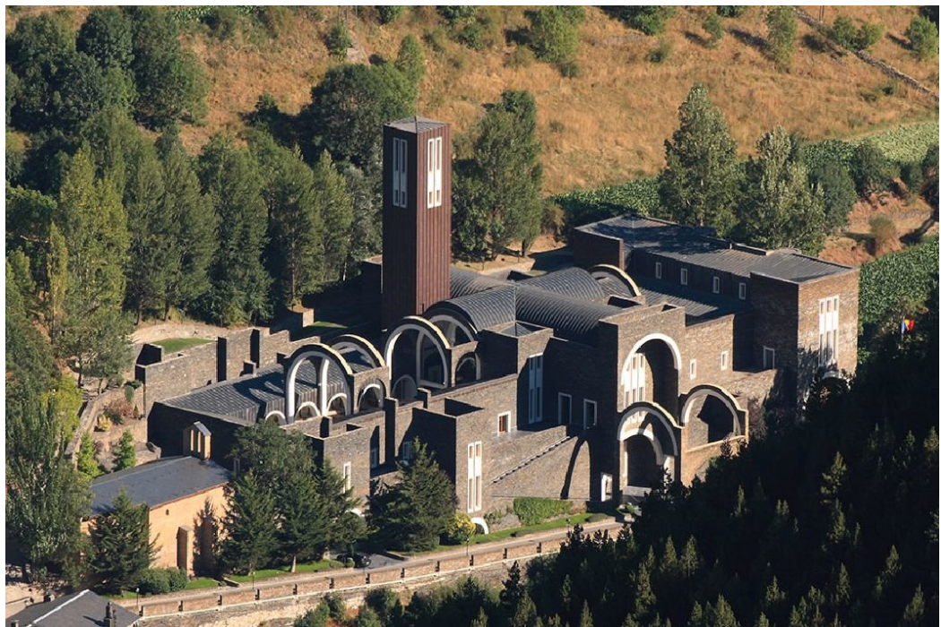
El Santuari de Nostra Senyora de Meritxell és del pocs edificis contemporanis rellevants que estan protegits.