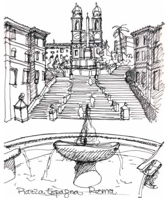
Fig.1. Dibuix de la plaça Spagna a Roma. E.Dilmé ( www.enricdilme.com/DIBUIXOS )

Les mil·lenàries places són salons urbans de trobada, de reunió, de concentració... on celebrar mercats, festes, balls, manifestacions... i per tant contra més lliure d'obstacles millor.