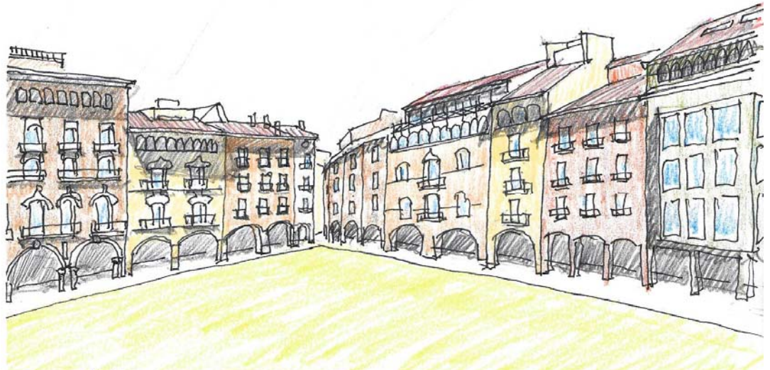
Fig.5. Dibuix de la plaça de Vic. E.Dilmé ( www.enricdilme.com/DIBUIXOS )

Si hi ha places dures deu ser perquè hi ha places toves. Quan una plaça és dura i quan tova? Depèn de la consistència del paviment que la cobreix? La plaça de Vic que és de sauló és tova o dura? La plaça de Catalunya de Barcelona que té fonts i arbrat envoltant el gran espai central es tova o dura? Quin percentatge de vegetació ha de tenir per ser considerada una plaça tova? Hi ha una escala de la duresa de les places com la de Mohs pels materials? Em sembla que se'ls hi gira feina als "plaçatovistes".