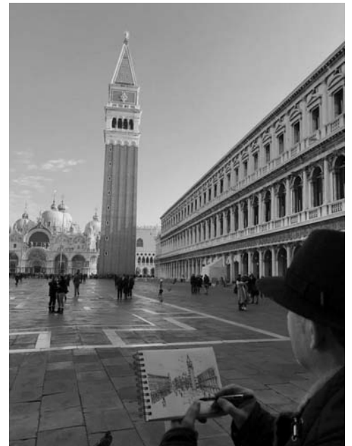
Fig.3. Plaça de Sant Pere a Venècia.