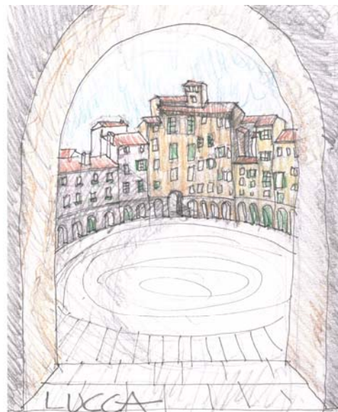
Fig.4. Dibuix de la plaça Lucca. E.Dilmé ( www.enricdilme.com/DIBUIXOS )