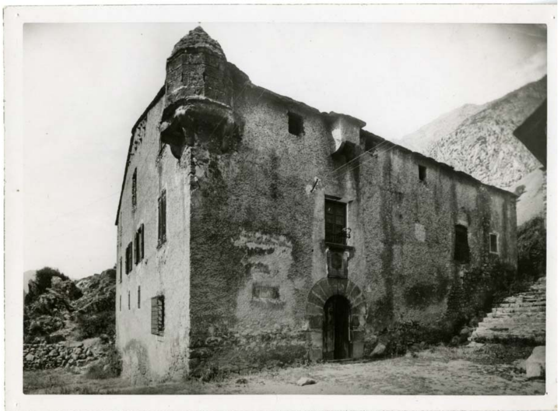
Fotografia de Casa de la Vall d'abans de les transformacions del segle XX.