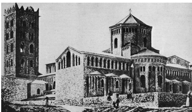
Fotografies d'abans i de després de la reconstrucció del monestir de Ripoll. Hereu i Payet, 1986.