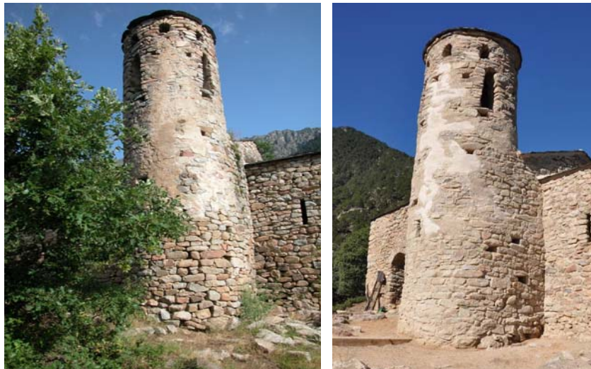
Fotografia d'abans i de després de la reconstrucció.

De ser certa l'anècdota penso que Martinell no devia emprar el mot "xalet", més nostrat, sinó, el de "torre", més habitual en l'Alt Camp, d'on era, o a Barcelona, d'on tenia el despatx professional. Si fos així la contesta hagués estat: Ens han fet una torre! Quelcom que, per ironia del destí, mig segle després, podríem tornar a emprar per Sant Vicenç d'Enclar. I el problema ara, no seria de substantius (al final estem parlant de sinònims), sinó de l'article que l'acompanya. El tema és que s'ha fet "una" torre però no "la" torre. La precedent. La que tocava fer i la que es van comprometre a fer (només cal veure les bases del concurs, la memòria del projecte i la infinitat de declaracions dels implicats, recollides per la premsa). Hi haurà passavolants que ja els hi estarà bé, que pensin que més val qualsevol torre que cap, però no hauria d'haver estat així. Ja que ens va caure teníem l'obligació de posar el màxim rigor en cada pas, en cada detall.