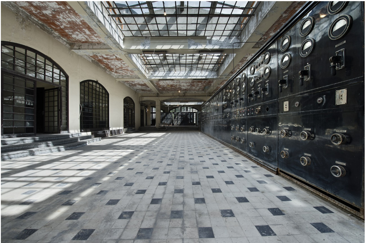
Sala principal. Ibidem.

l'estructura de pòrtics de formigó i claraboies zenitals 2 ) o en el sofisticat treball d'estereotomia dels elements cilíndrics (torre de guaita i torre campanar) que, amb els seus carreus corbs, són, sense dubte, el millor treball d'afaiçonament de l'arquitectura andorrana.