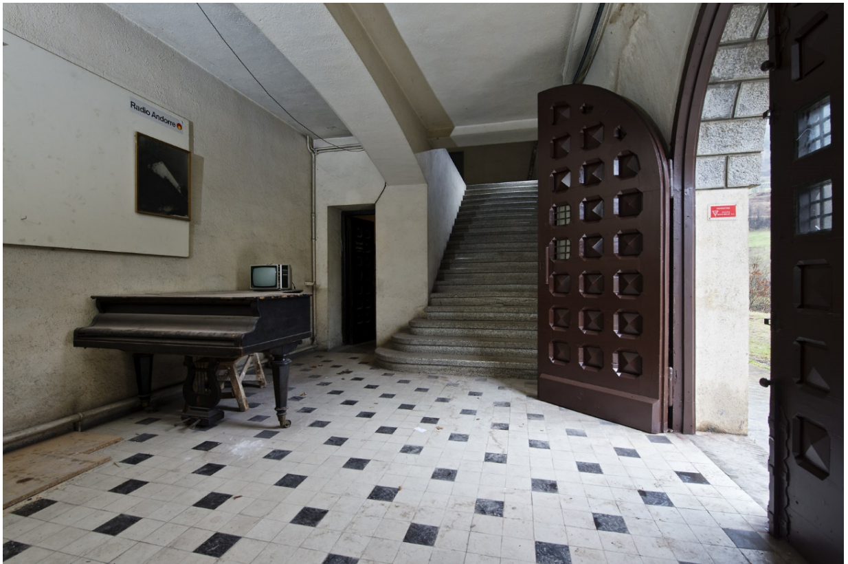
Entrada Principal. Ibidem.

Cal afegir que aquests elements arquitectònics no es troben disposats de forma aleatòria, sinó que segueixen un programa escenogràfic perfectament estudiat, ja que s'endrecen de forma esglaonada per a assolir la màxima seducció en l'observador, defugint fins i tot la relació amb l'ús interior de cada peça (accentuant així la ferma voluntat representativa de l'edifici). Endemés, l'atmosfera suggestiva es reforça amb la plantació de coníferes que envoltaven l'edifici fent-lo sobresortir com d'una clariana del bosc. Així, el visitant descobreix primer la façana més monumental, culta i treballada (tot i ser la que tanca els tallers i dóna entrada al material pesant), per, un cop passada la torre circular (situada, no per casualitat, en el punt més sortit de l'edifici i, per tant, en la part més encarada a la vall), arribar a la façana més tradicional i domèstica (que serveix d'accés principal a l'edifici), per repetir aquest esquema en la més privada façana interior amb la qual cosa l'alçat queda com a simple parament de tancament, amb un mínim afany compositiu.