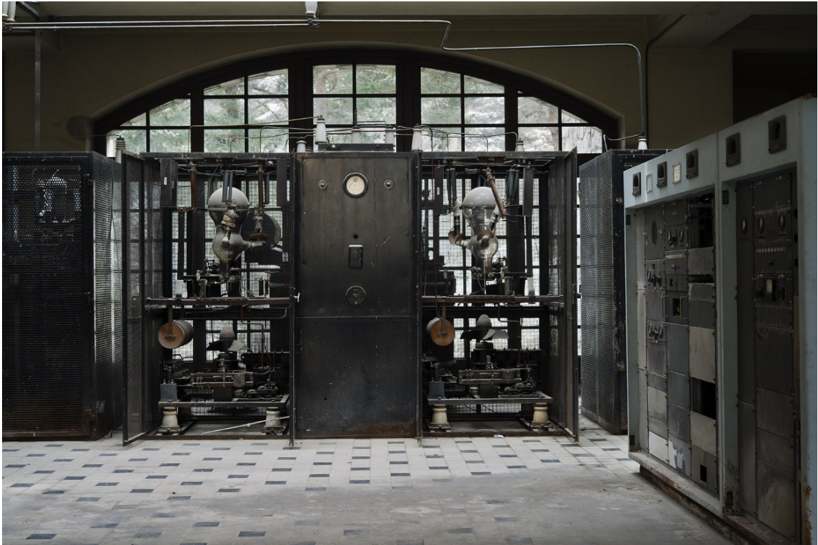
Làmpades de mercuri. Ibidem.

Hom pot veure, doncs, que Ràdio Andorra és un edifici singular, amb uns valors històrics i arquitectònics excepcionals que han estat reconeguts oficialment amb la seva inclusió, l'any 2004, en l'Inventari general del patrimoni cultural d'Andorra.