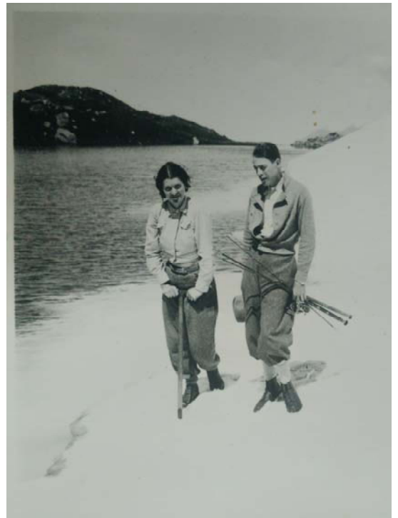
Fotografies de l'àlbum familiar de la nevoda d'en Trilhe. Anys 30-40.

Ara sabem que el nostre personatge va tenir una carrera interessant amb edificis destacats a l'Occitània. La seva vida i obra ens la ha resumit en Pere Fiñana tal com segueix: