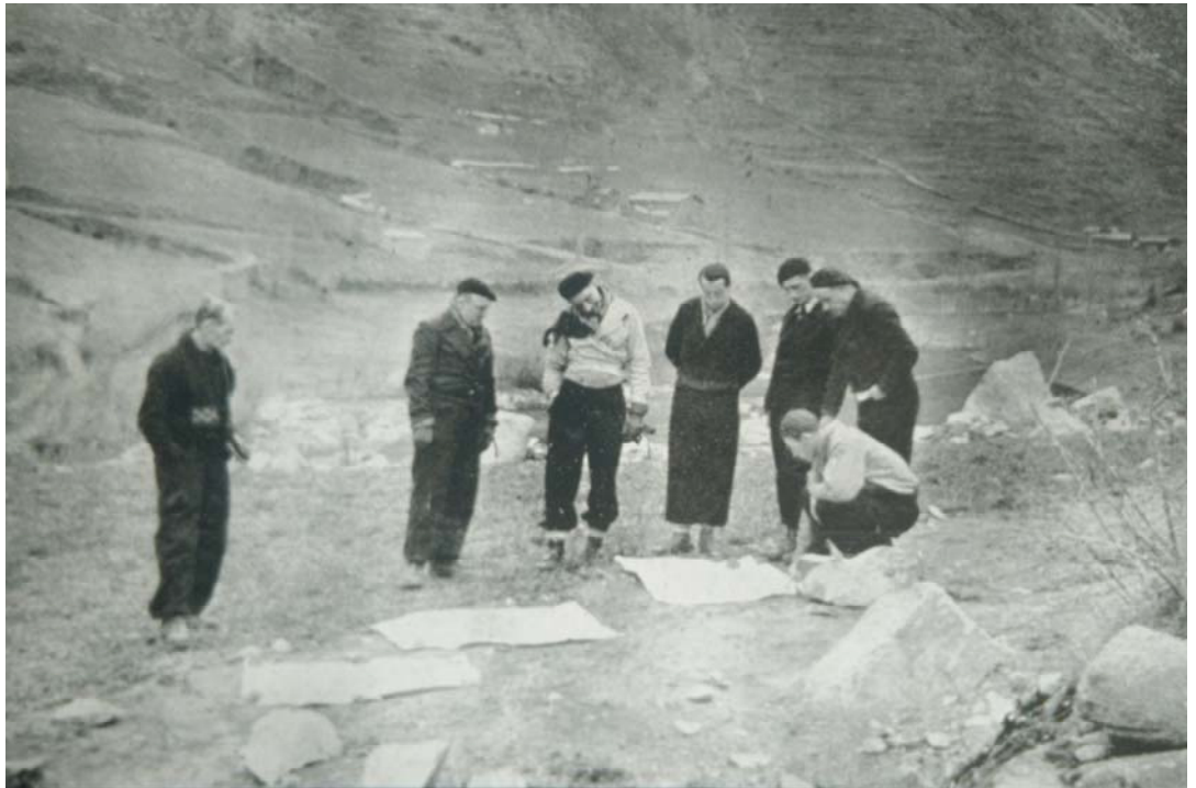
Primeres visites a les obres de Ràdio Andorra.

La data de la seva mort s'estima entre 1959 i 1960.